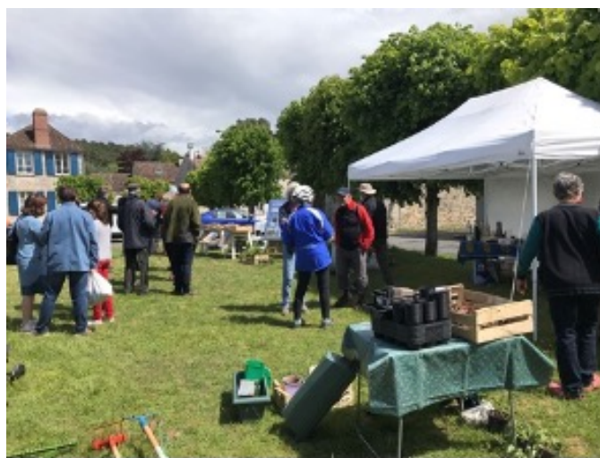
Trocante du jardin 2021